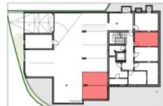
TIFFGARAGESTELLPLATZ UND KELLERABTEIL

Die Planmaße können sich im Laufe der Bauzeit geringfügig ändern. Für die Planung der Möblierung sind Naturmaße zu nehmen. Irrtum und Druckfehler vorbehalten.