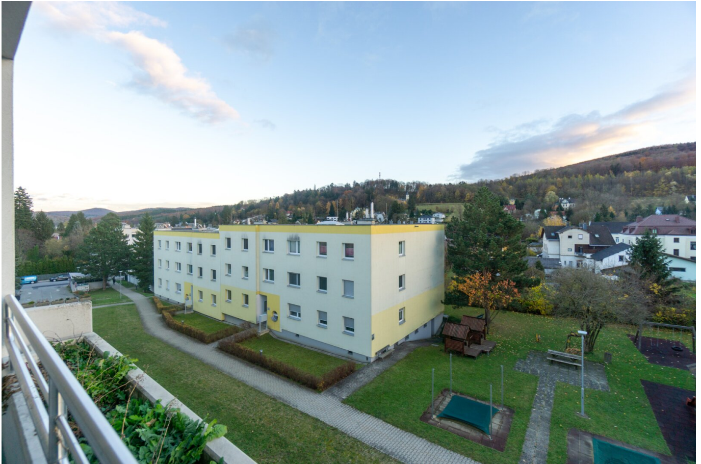
Ausblick Loggia 1