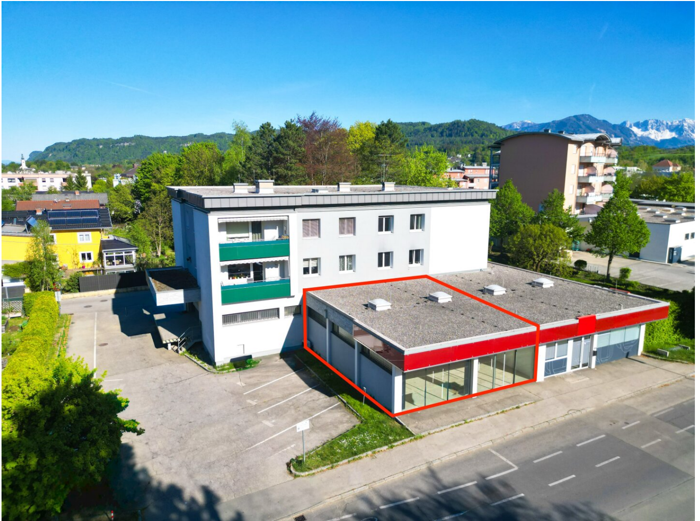
Luftbild mit eingezeichneter Gewerbefläche