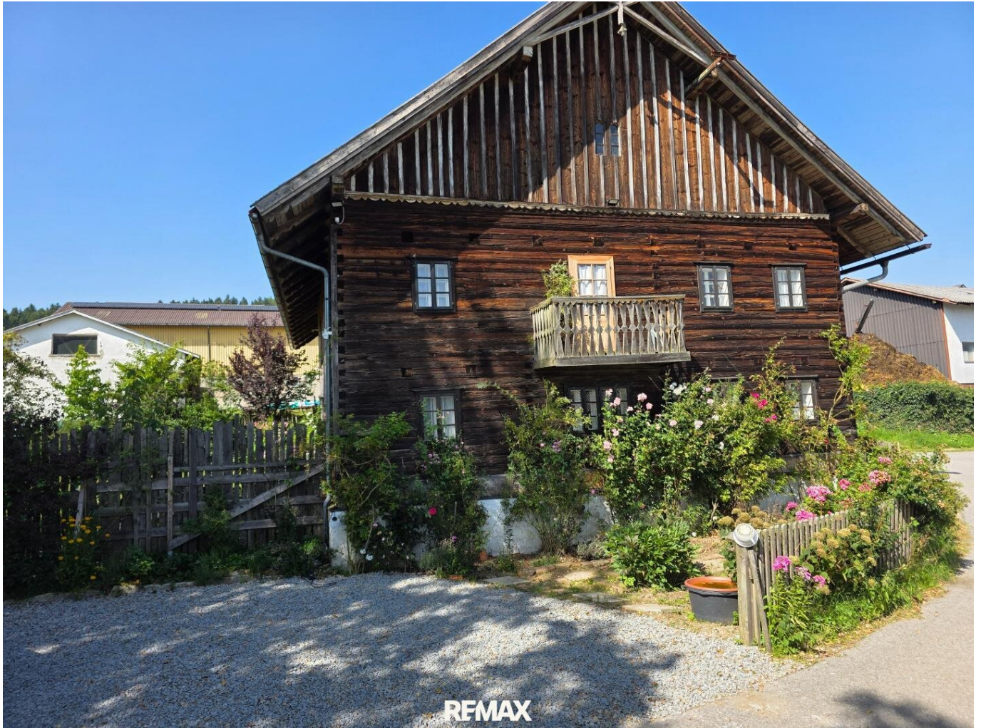
Haus St. Aegidi