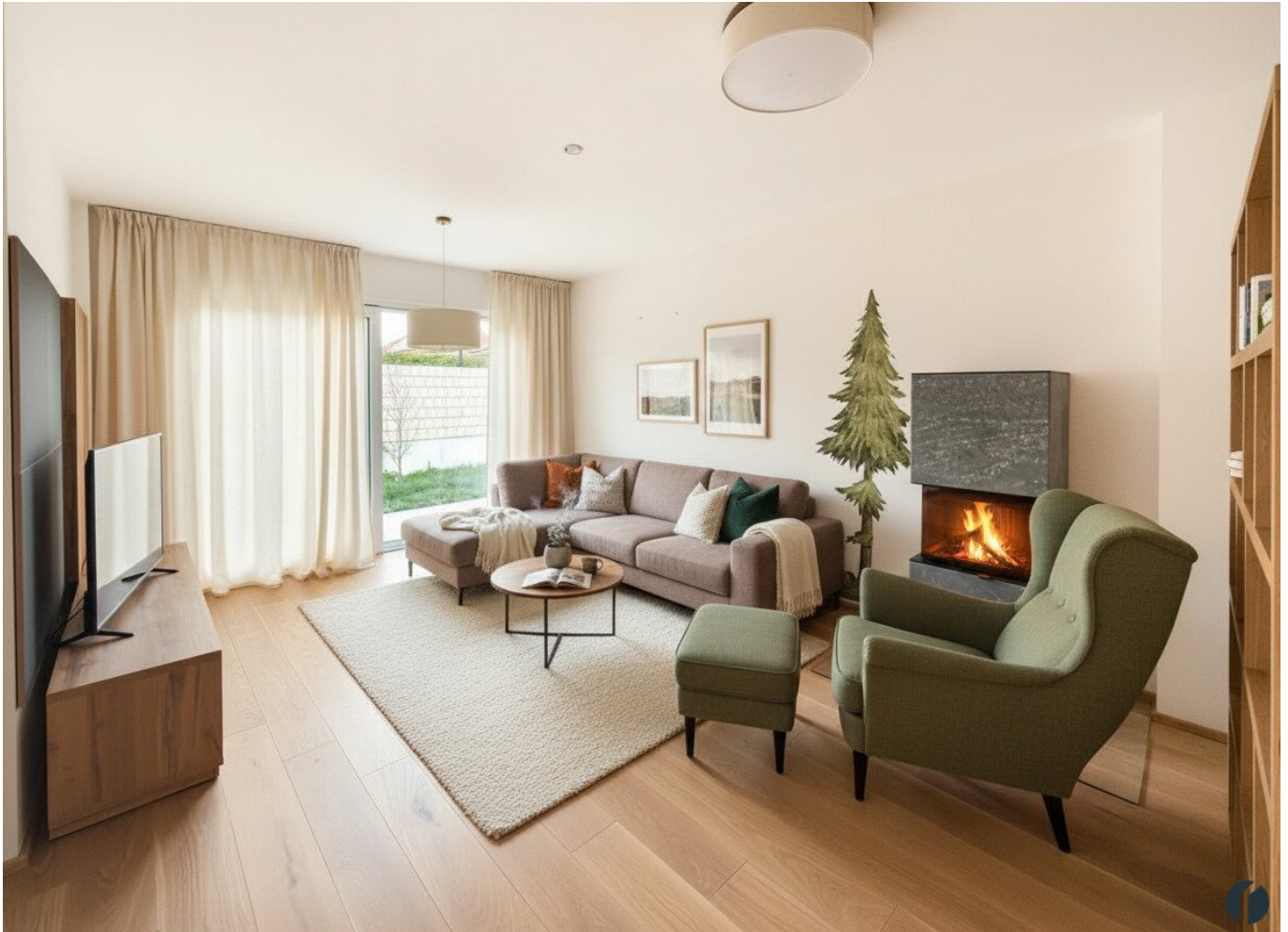
Einrichtungsbeispiel Wohnzimmer (KI_generiert)