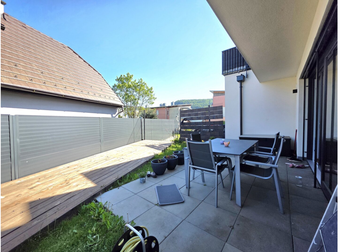
Garten und Terrasse