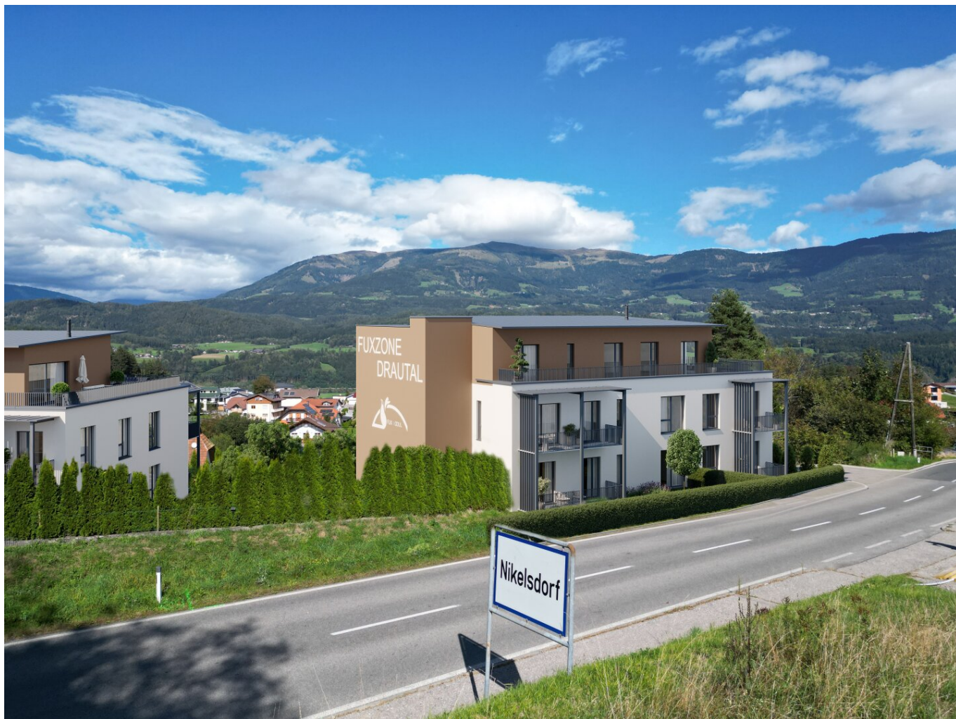
Baufortschritt, Stand 07.04.2026