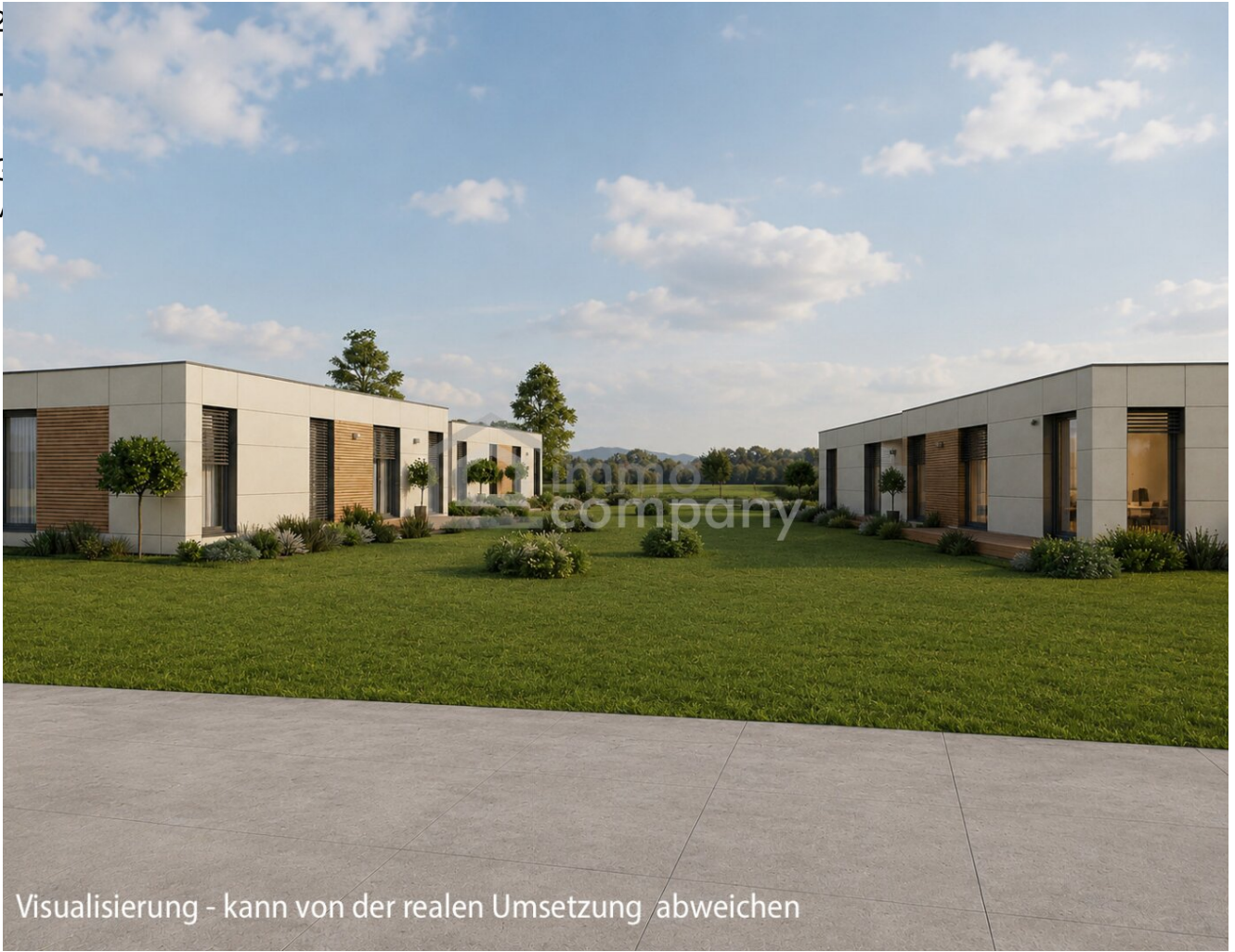
Visualisierung - kann von der realen Umsetzung abweichen