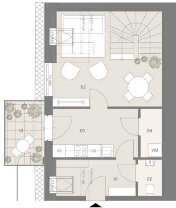
1. Dachgeschoss - Eingang