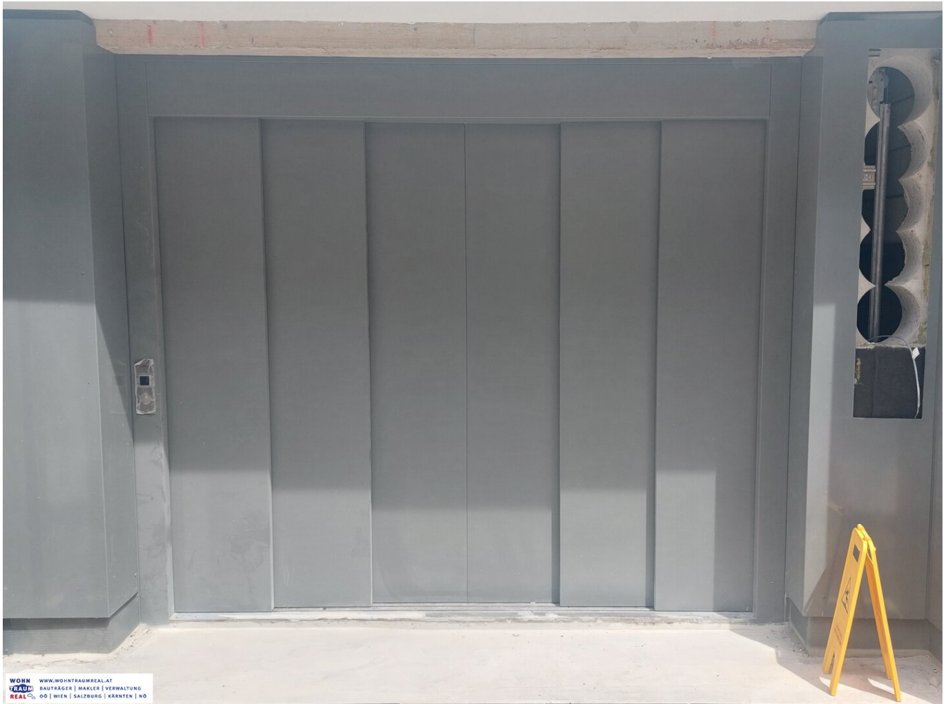
Tiefgarage mit Lift