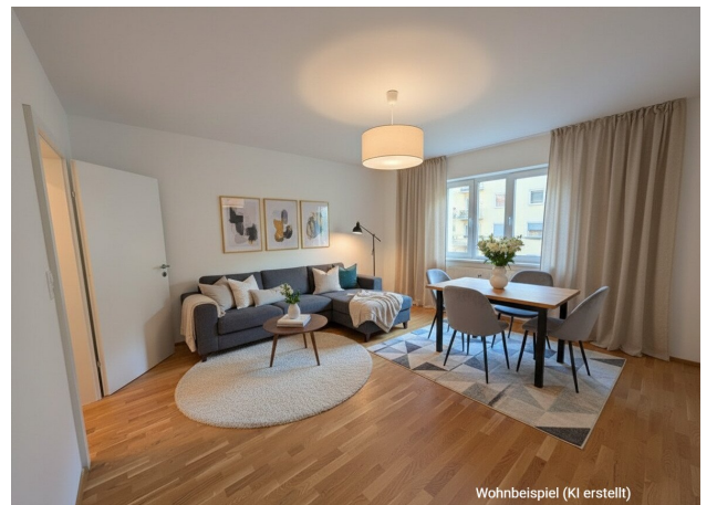
Wohnbeispiel (KI erstellt)