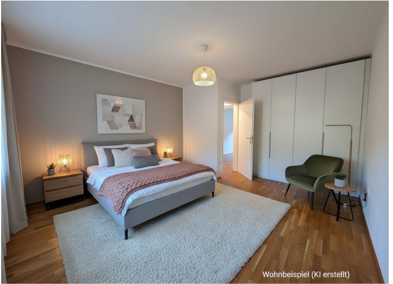
Wohnbeispiel (KI erstellt)