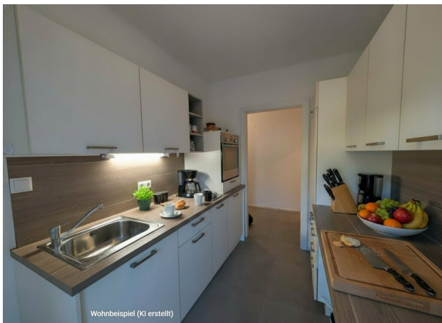
Wohnbeispiel (KI erstellt)