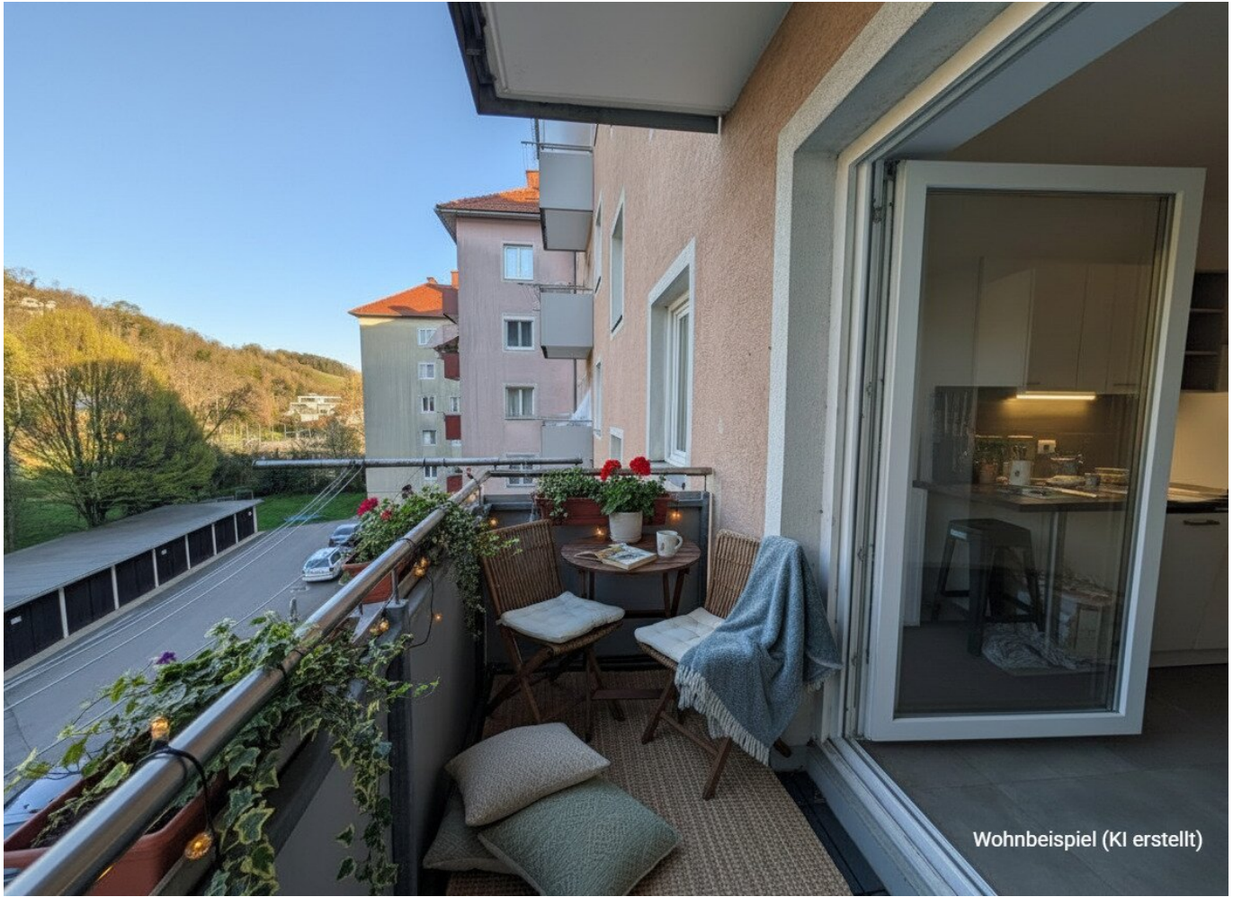
Wohnbeispiel (KI erstellt)