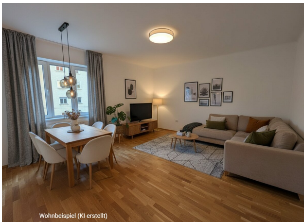
Wohnbeispiel (KI erstellt)