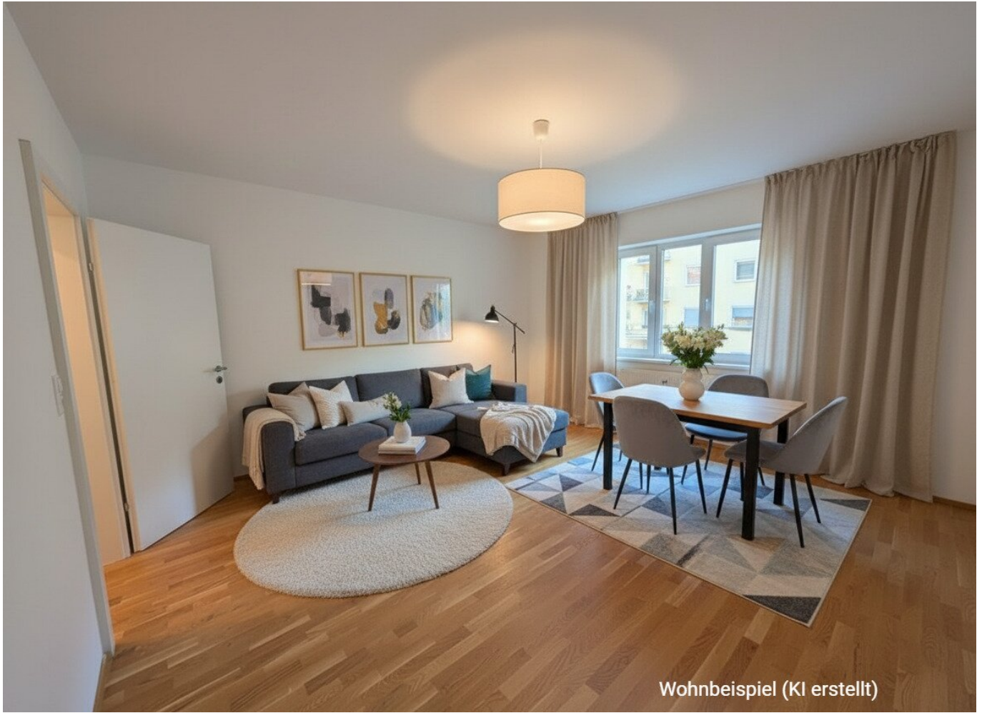
Wohnbeispiel (KI erstellt)