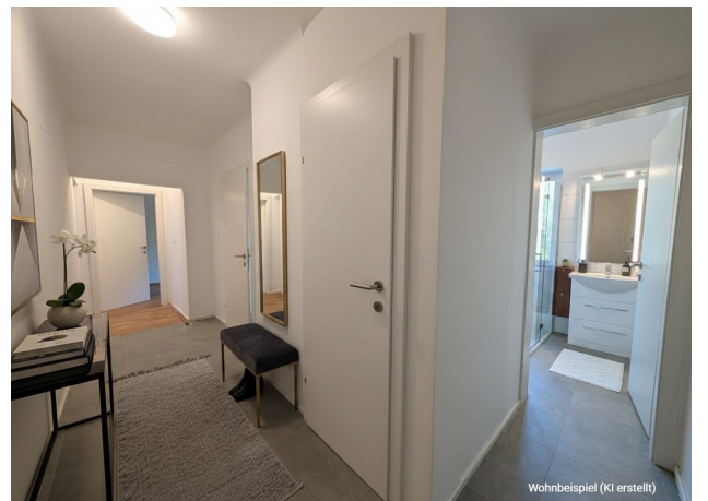
Wohnbeispiel (KI erstellt)