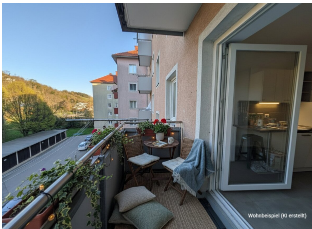
Wohnbeispiel (KI erstellt)