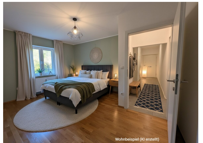
Wohnbeispiel (KI erstellt)