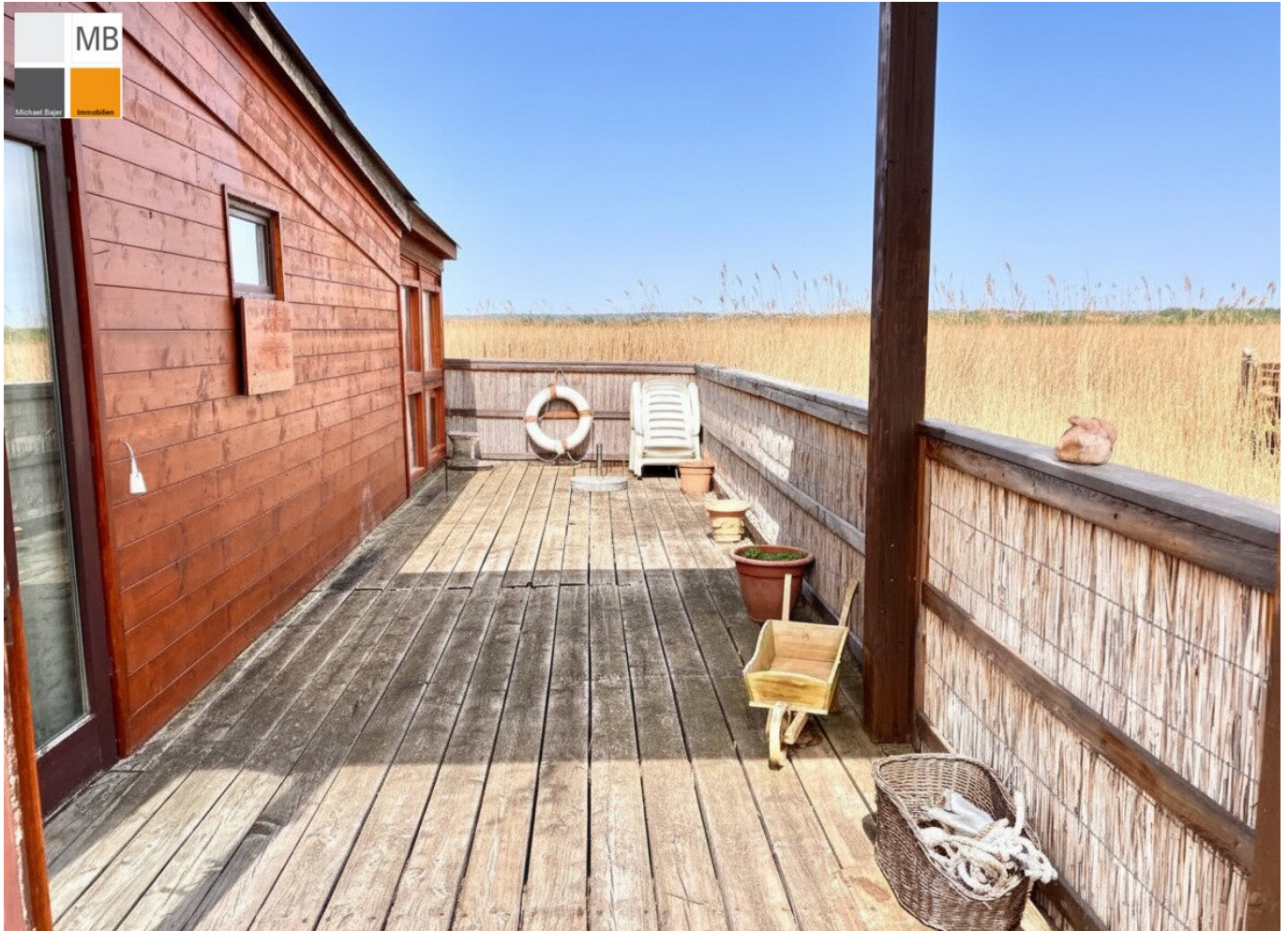
Ausblick und Terrasse