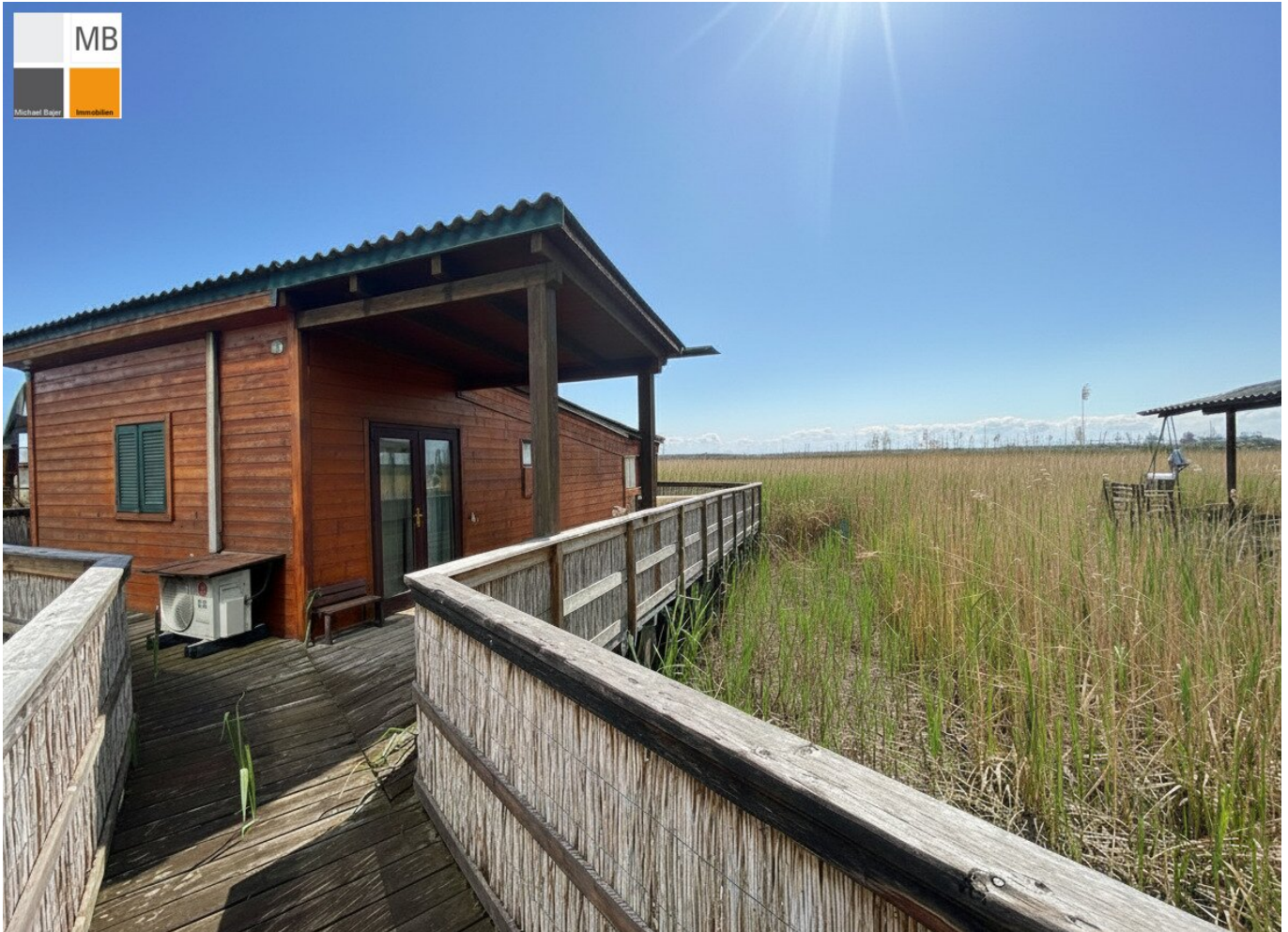
Haus im See