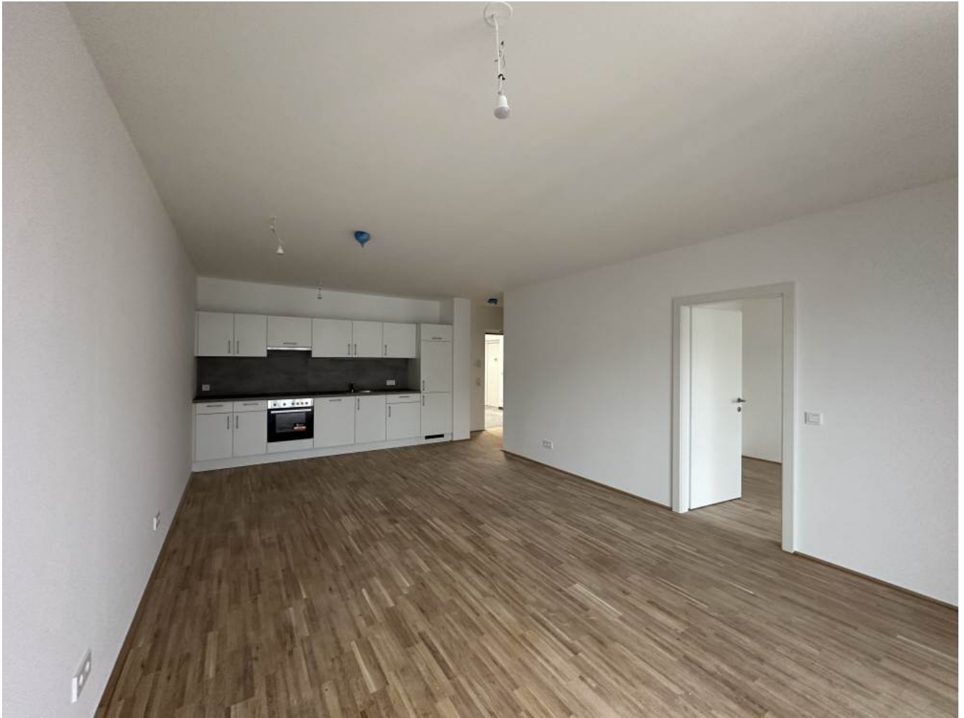
Muster Wohnküche (3)