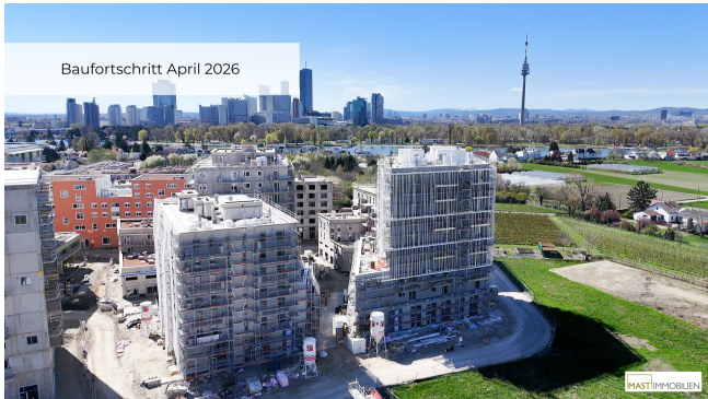
Baufortschritt April 2026