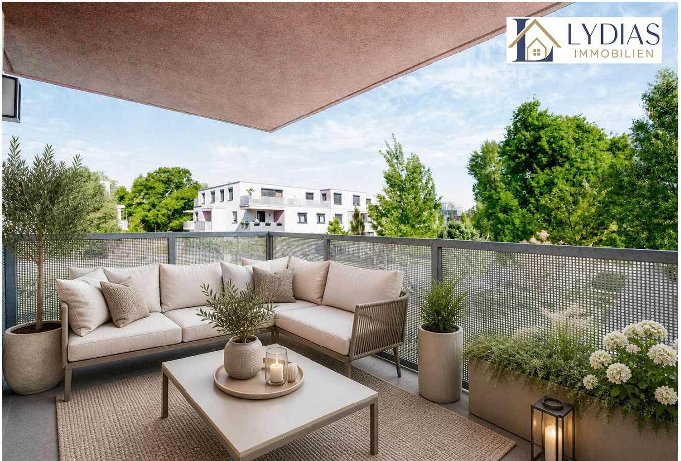
Balkon (Virtual Staging)

Objektnummer: 1801/102 Eine Immobilie von Lydias Immobilien