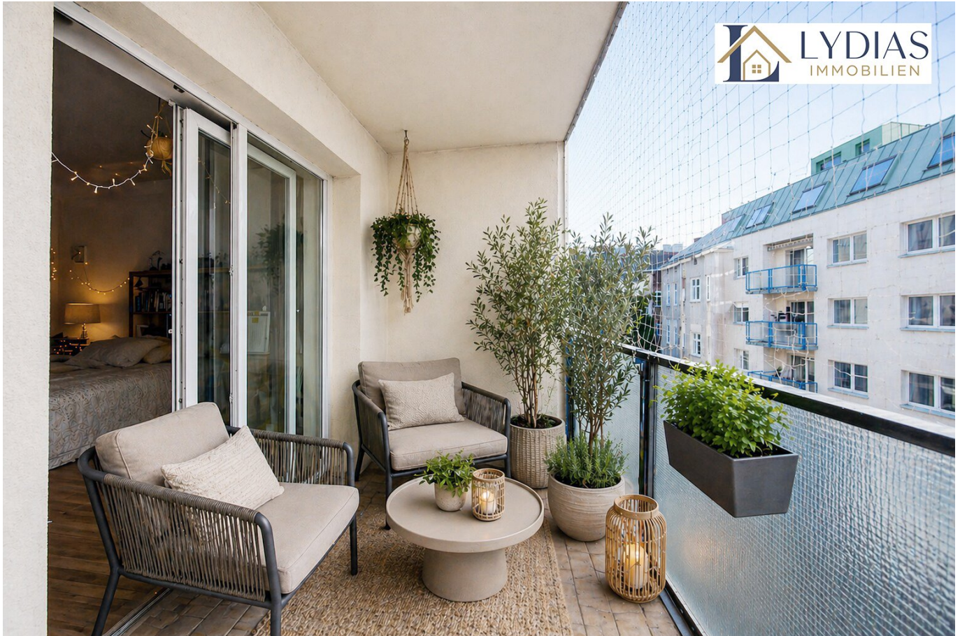
Balkon (Virtual Staging)

Objektnummer: 1801/100 Eine Immobilie von Lydias Immobilien