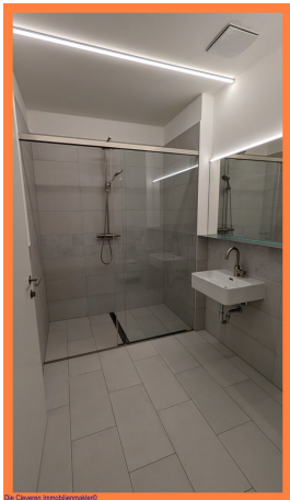
Die Cleveren Immobilienmakler©