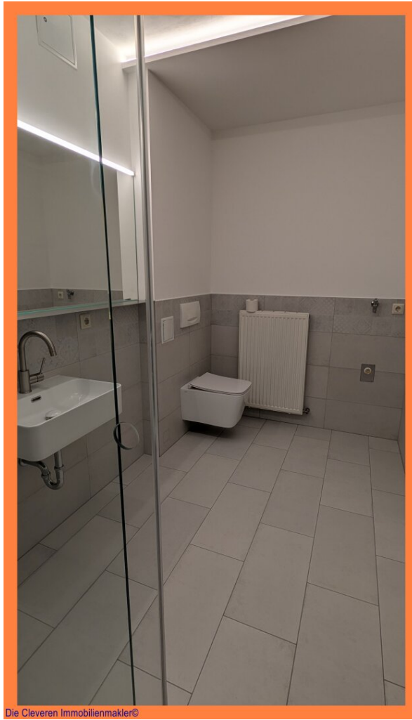
Die Cleveren Immobilienmakler©