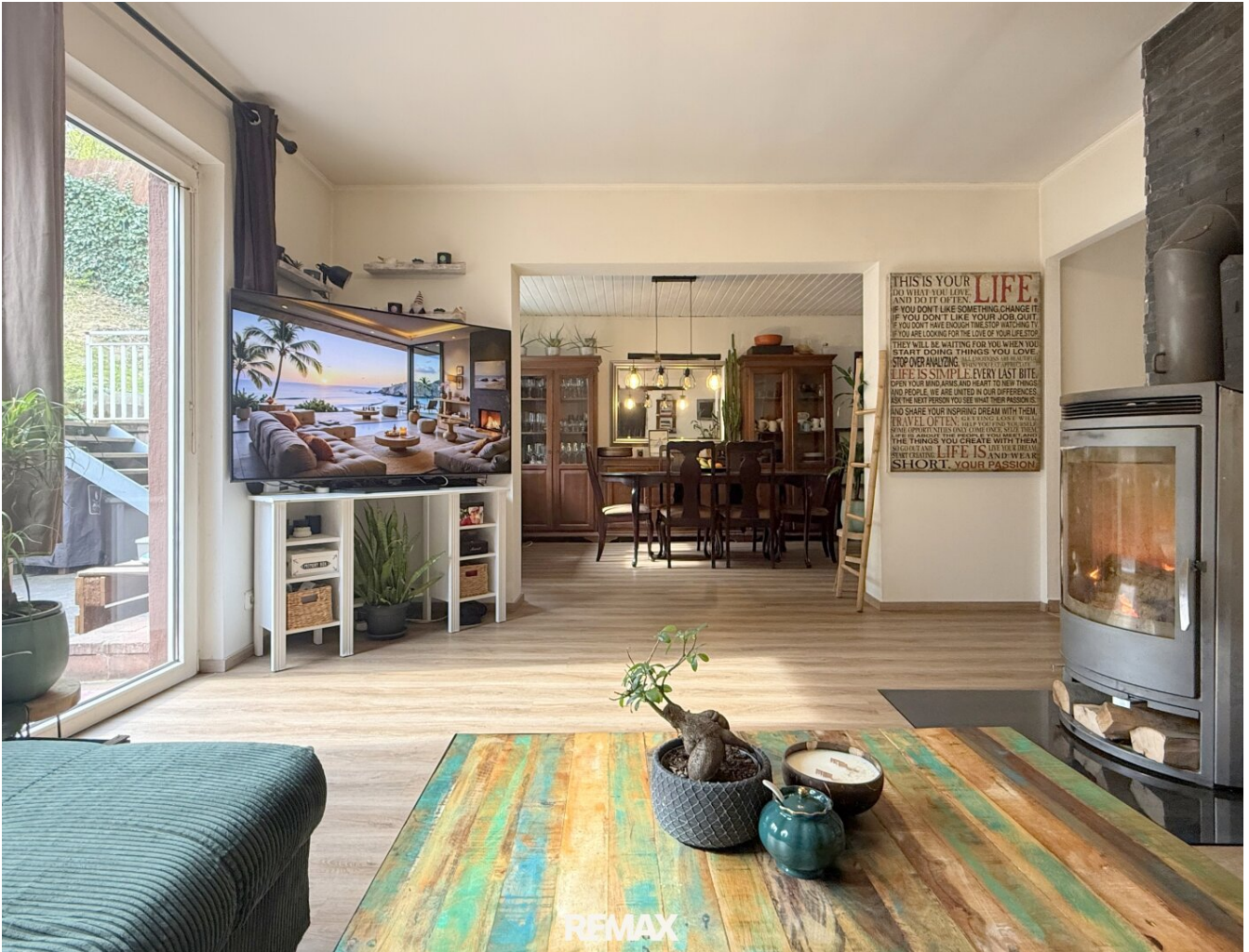
Erdgeschoss - Wohnzimmer