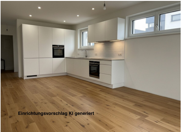
Einrichtungsvorschlag KI generiert