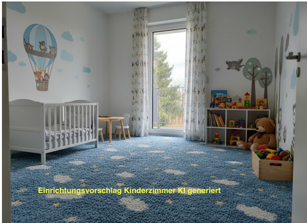
Einrichtungsvorschlag Kinderzimmer KI generiert