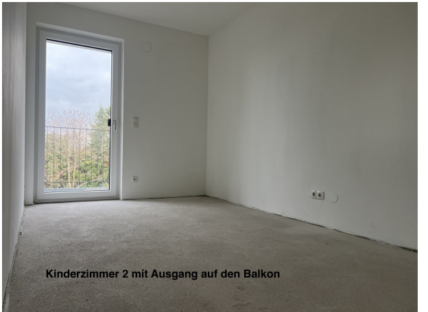
Kinderzimmer 2 mit Ausgang auf den Balkon