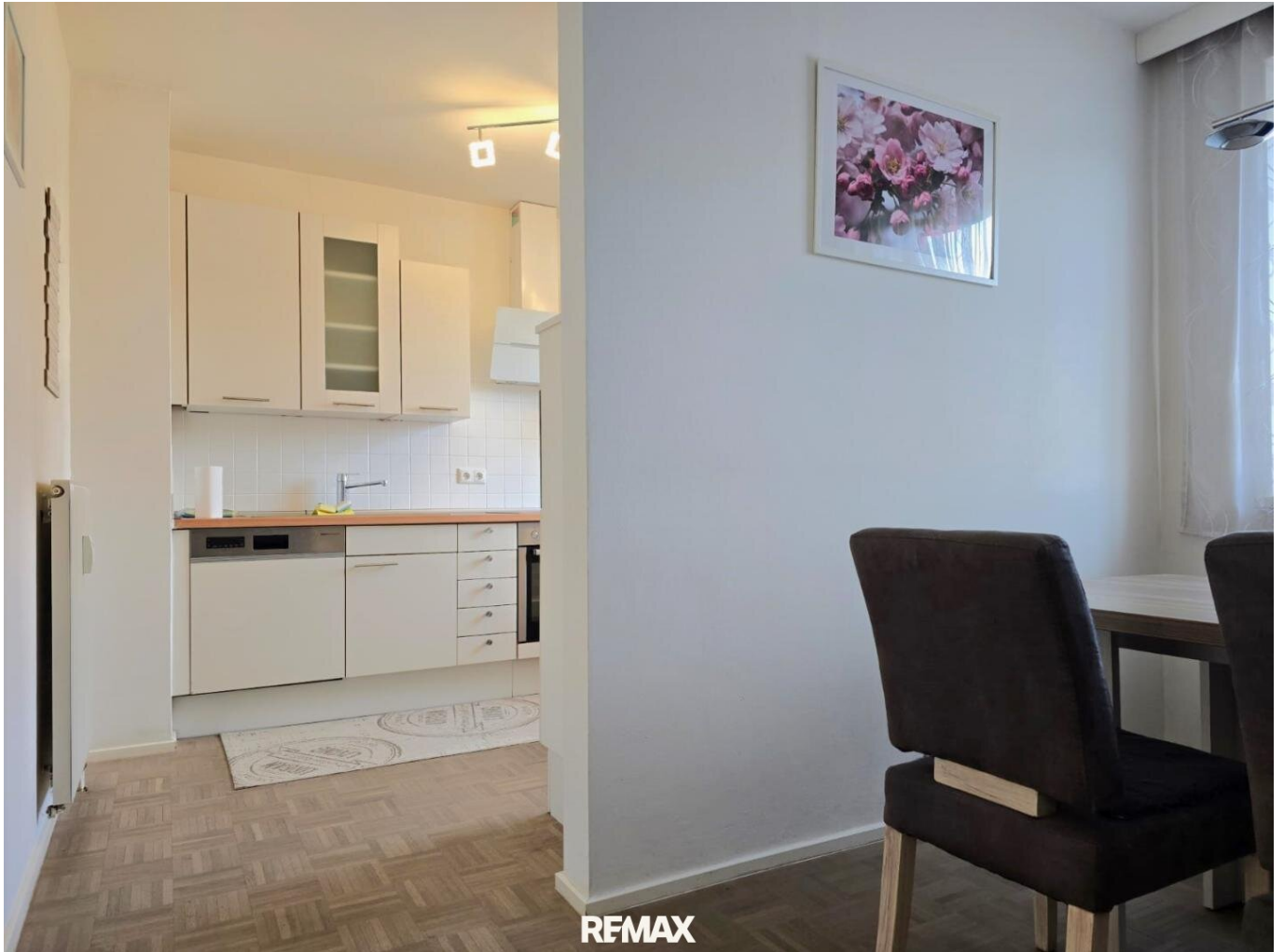
Küche + Essbereich