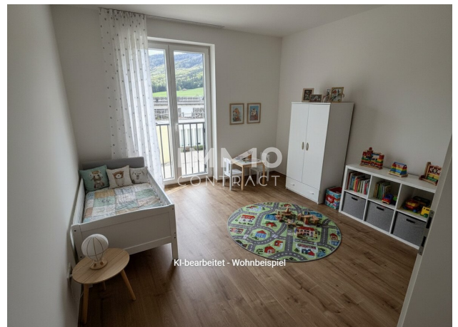
KI-bearbeitet - Wohnbeispiel