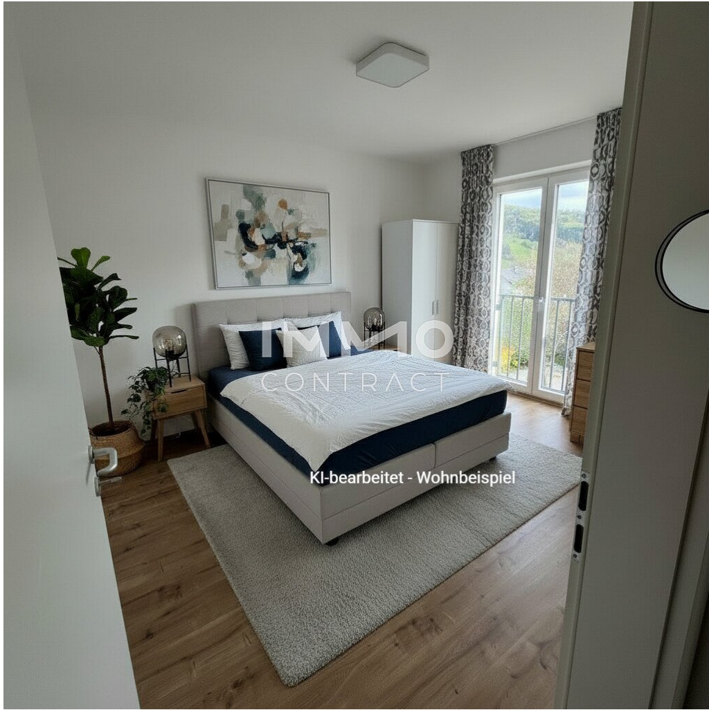
KI-bearbeitet - Wohnbeispiel