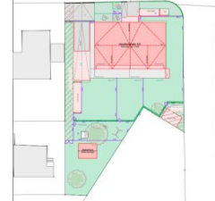
Tiefgarage / Keller