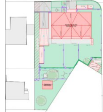
Tiefgarage / Keller