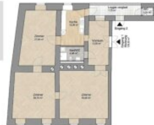
Grundriss Wohnung, 1:100

In der Rate sind alle Finanzierungsnebenkosten eingerechnet. Kondition und Rahmenbedingungen abhängig von Prüfung der Bonität, Belehnungsgrenze, Alter und Laufzeit! Gesamtbelastung EUR 698.460,-; Effektivverzinsung 3,75 % (Kosten können sich noch um die Pfandrechtsgebühren reduzieren)