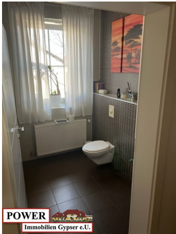
POWER Immobilien Gypser e.U.