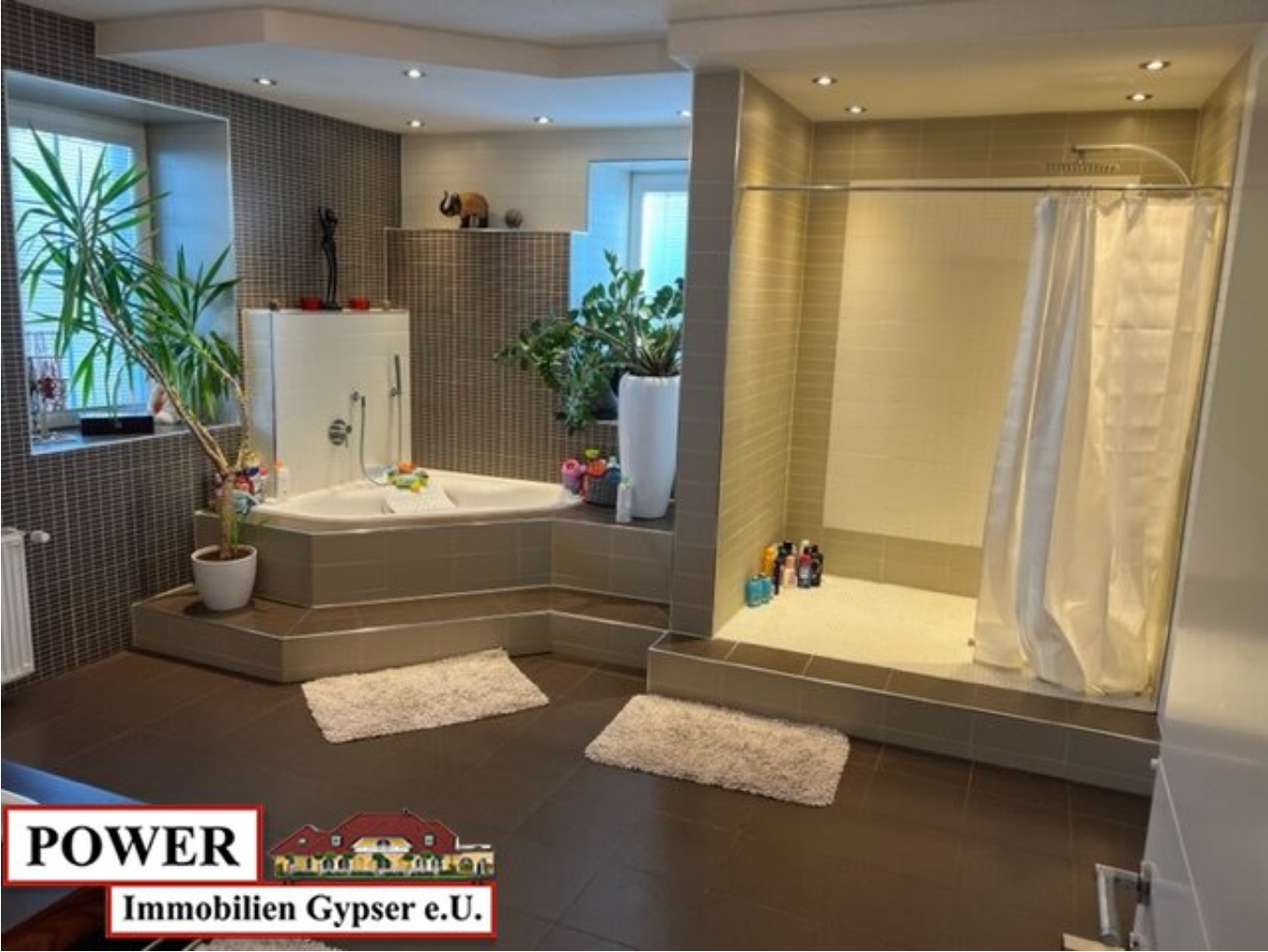
POWER Immobilien Gypser e.U.