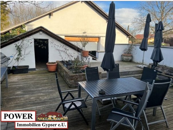
POWER Immobilien Gypser e.U.