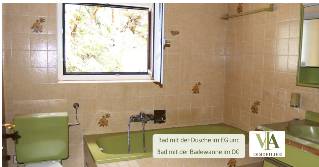
Bad mit der Dusche im EG und Bad mit der Badewanne im OG