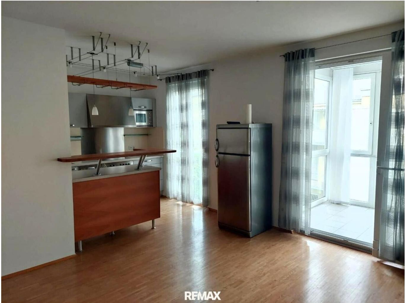
Küche mit Ausgang auf den Wintergarten