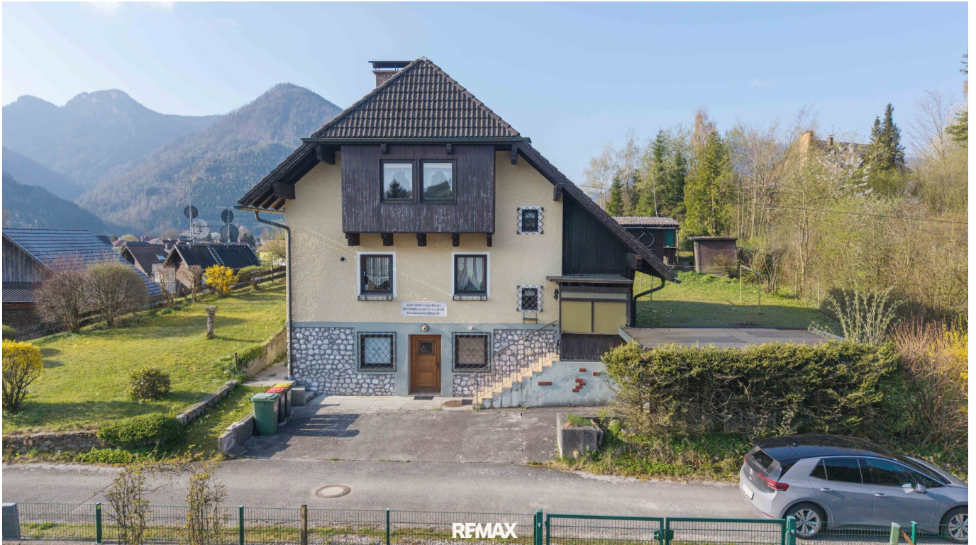
Hausansicht - Zufahrt