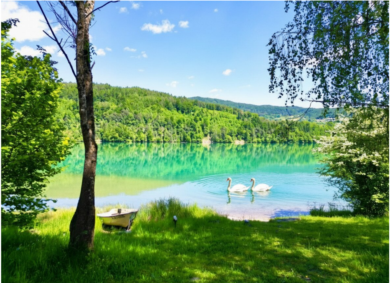
Bild vom See