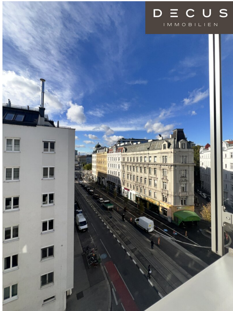
5. OG - Ausblick Eckbüro

| Großzügige Büroflächen im Herzen von 1090 Wien | insgesamt rund 3.000 m 2 für Ihre Vision!