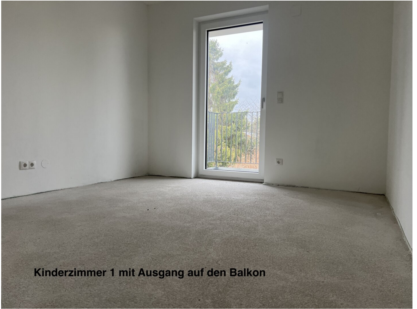
Kinderzimmer 1 mit Ausgang auf den Balkon