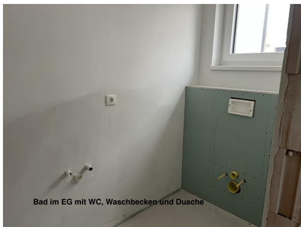
Bad im EG mit WC, Waschbecken und Dusche