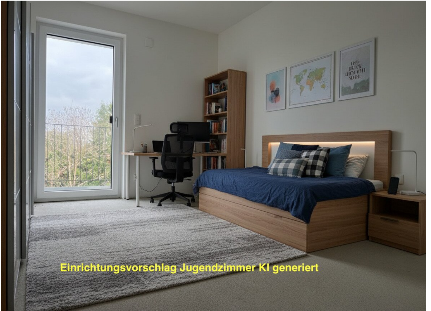
Einrichtungsvorschlag Jugendzimmer KI generiert