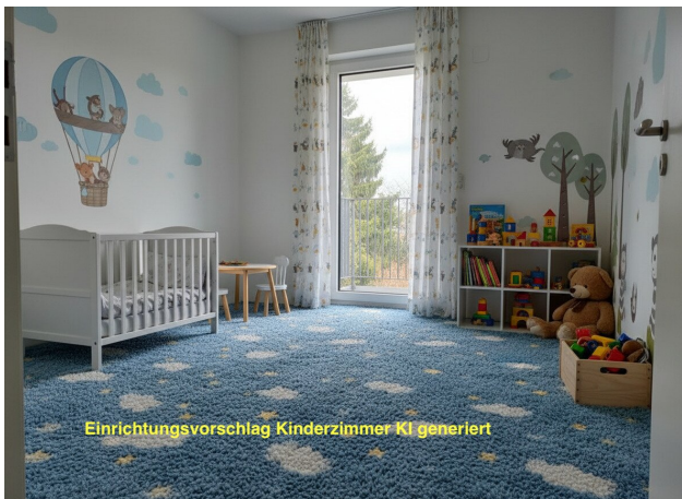
Einrichtungsvorschlag Kinderzimmer KI generiert