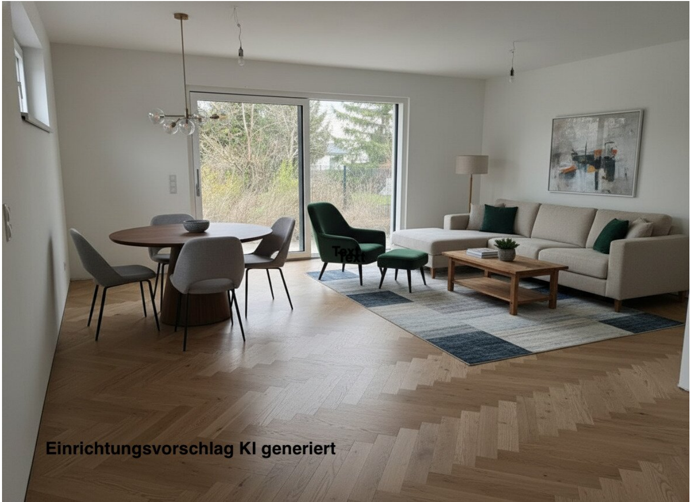
Einrichtungsvorschlag KI generiert