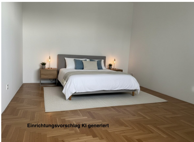
Einrichtungsvorschlag KI generiert