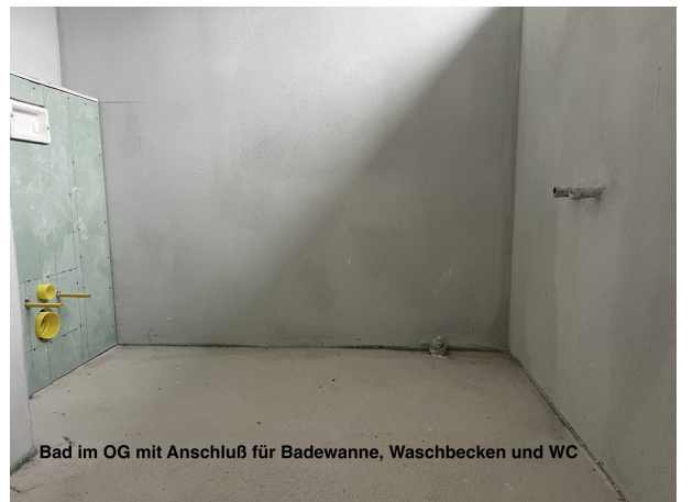
Bad im OG mit Anschluß für Badewanne, Waschbecken und WC