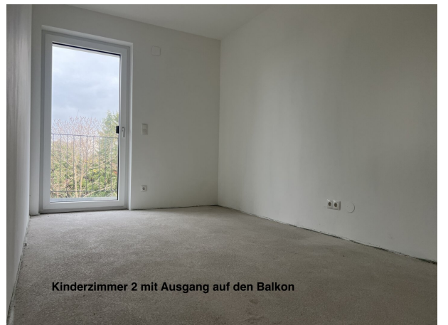
Kinderzimmer 2 mit Ausgang auf den Balkon