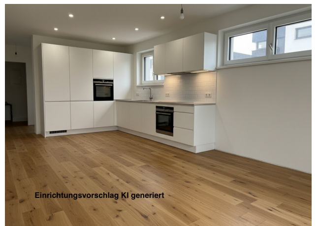
Einrichtungsvorschlag KI generiert