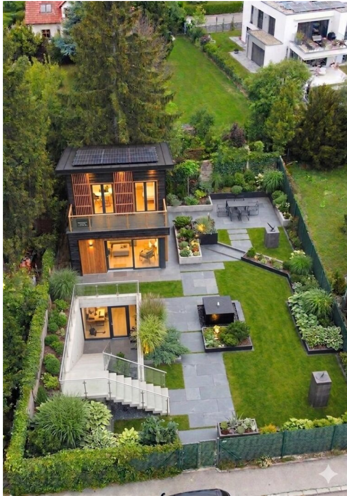
Gestaltungsbeispiel - Visualisierung