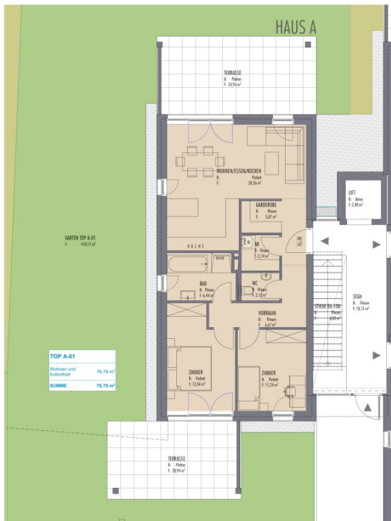
0. Erdgeschoss Haus A 75 1:100