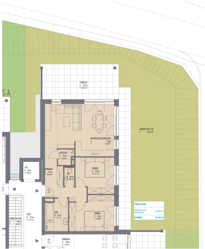
0. Erdgeschoss Haus A 75 1:100