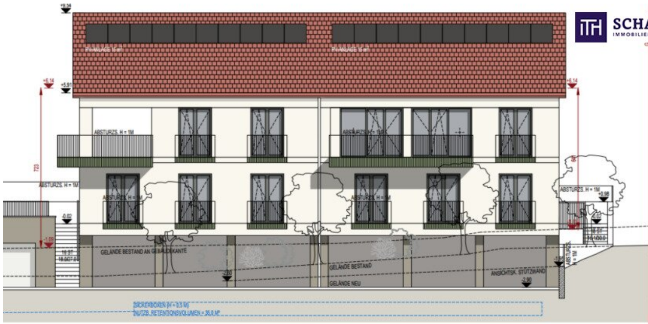
ANSICHT VON SÜD-OST / SCHNITT D-D 1:100