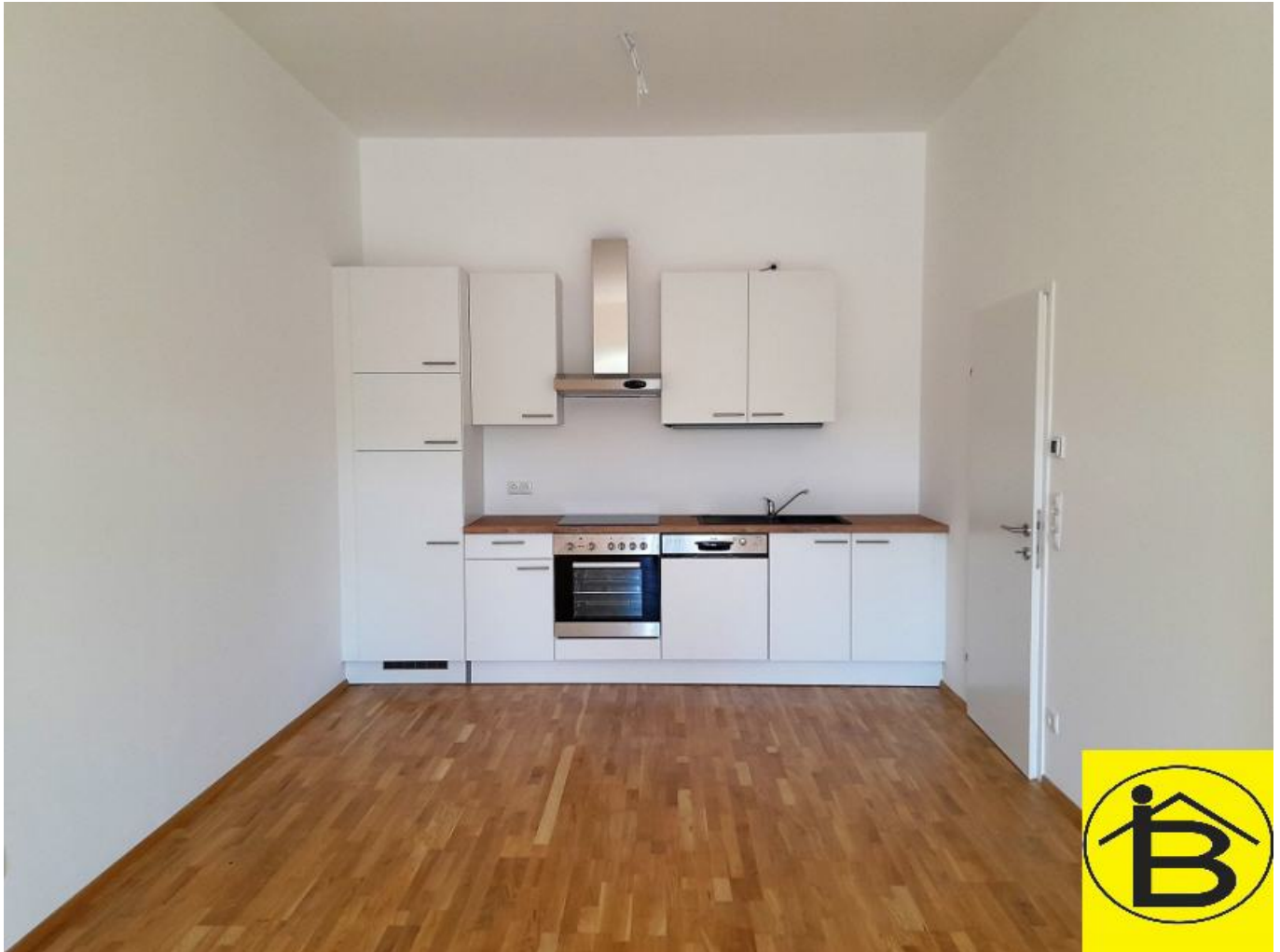
Top 15 Wohnküche

Objektnummer: 215/15513 Eine Immobilie von Borger Immobilien