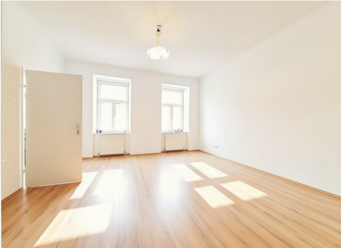
Wohnzimmer (Wohnung 1)