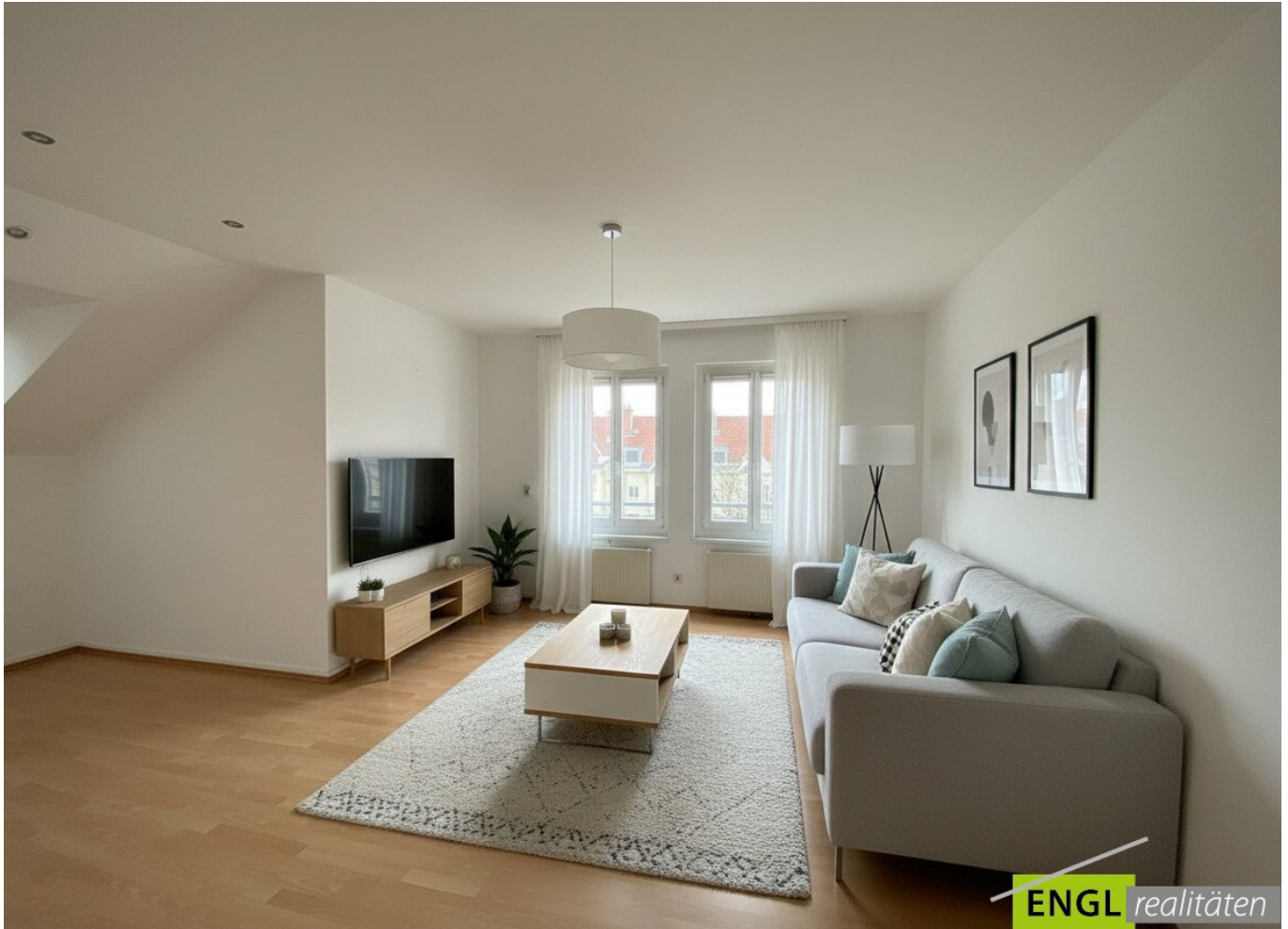
Wohnzimmer mit Einrichtungsvorschlag

Objektnummer: 7536/135 Eine Immobilie von Engl Realitäten GmbH