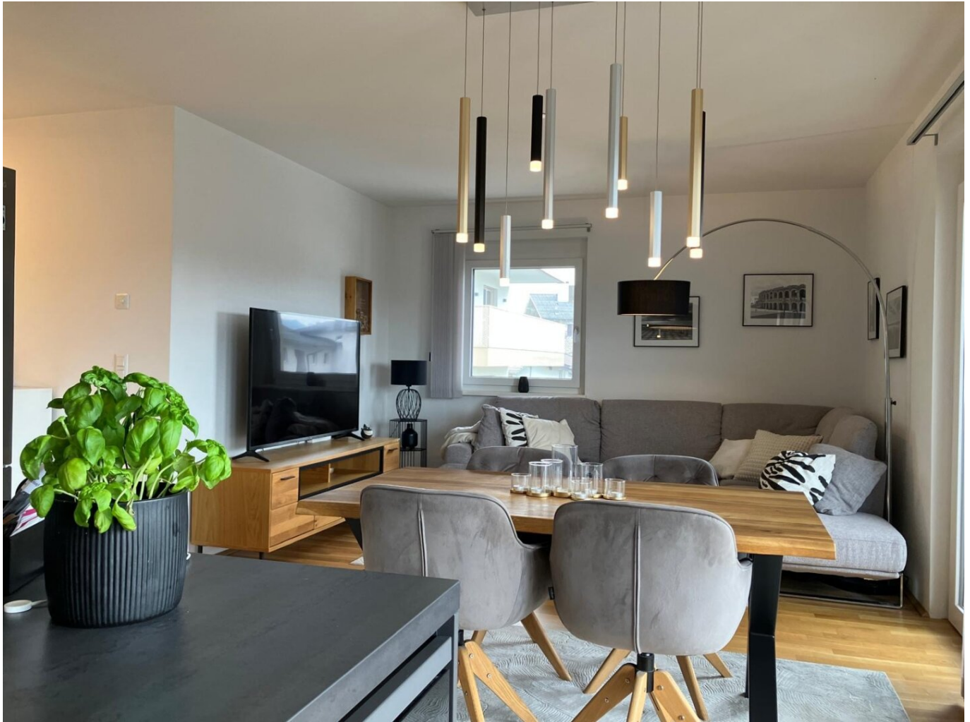
Wohn / Essbereich