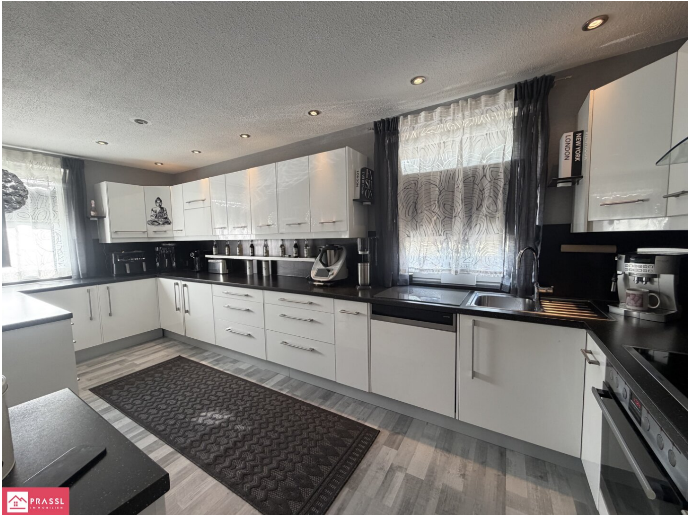
OG - Einbauküche mit Insel