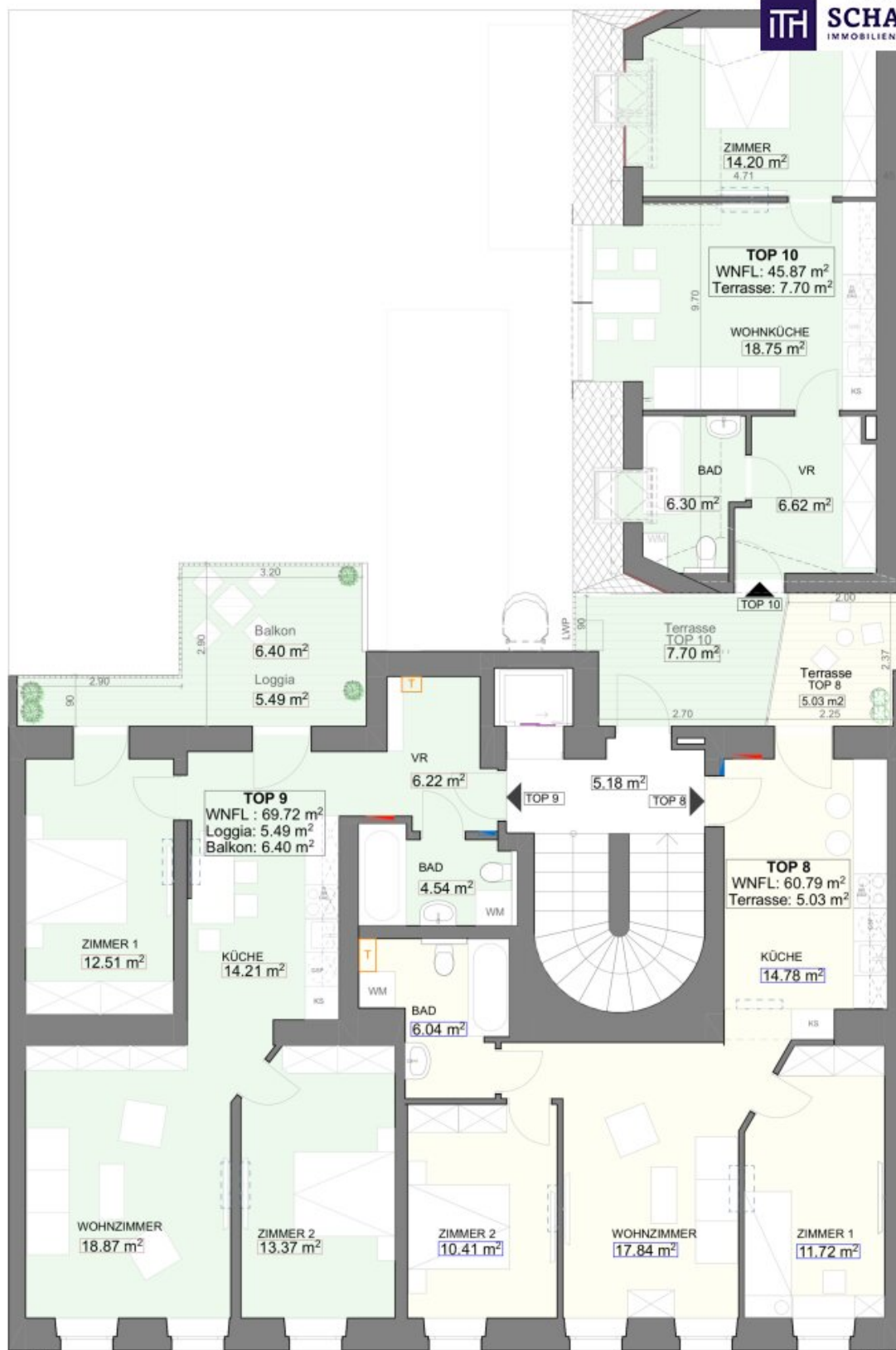
TOP 9 THALIASTRASSE 35 2. STOCK TOP 8