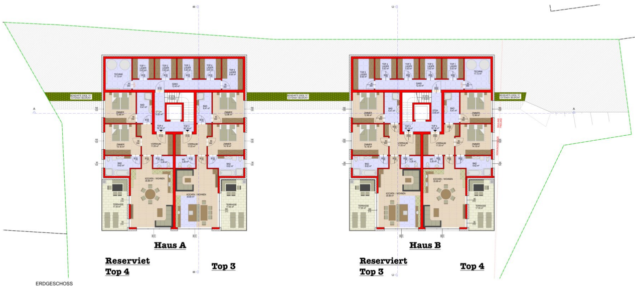
Haus A Reserviert Top 4 Top 3