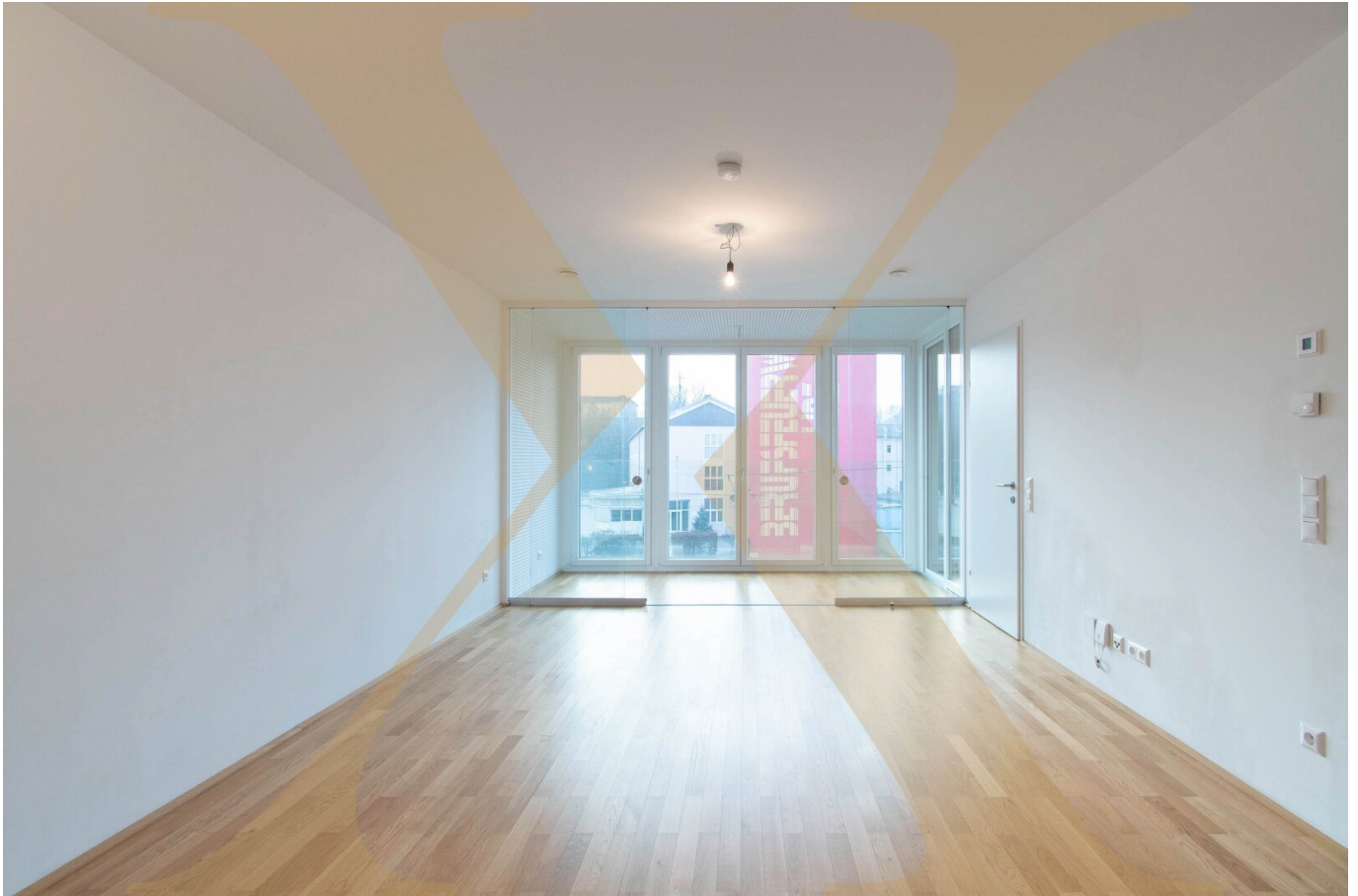
Beispielfoto Wohn-/Essbereich I