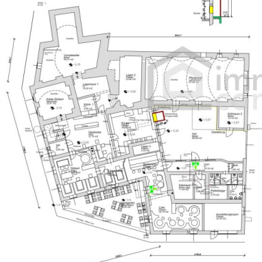
SCHNITT Speisenaufzug NEU Fa. Kone