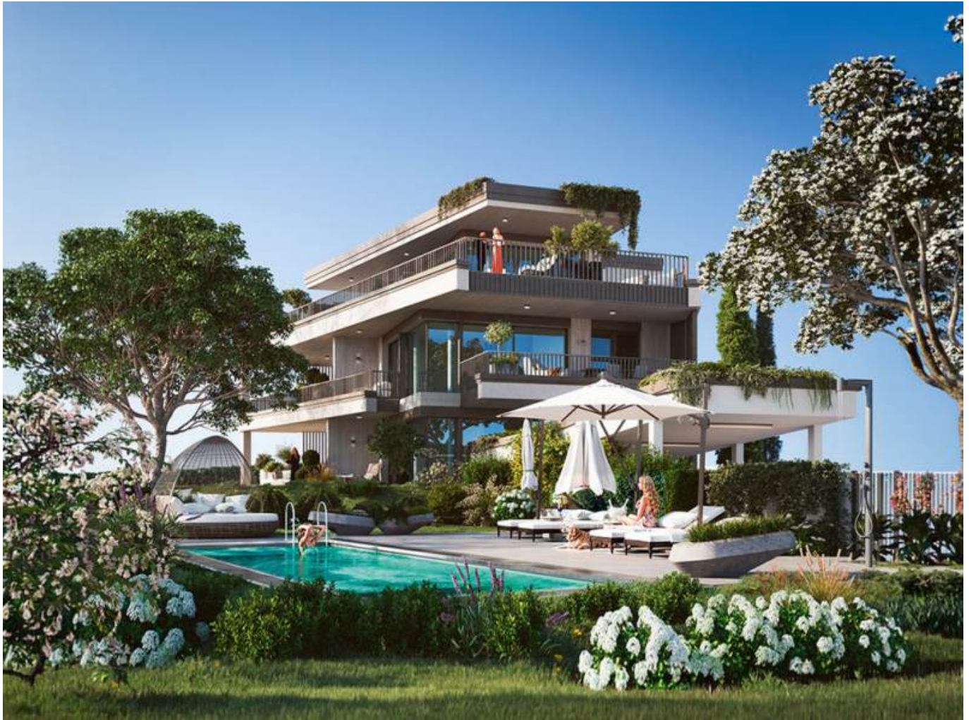
Villa 112 Süd

Objektnummer: 905/03634 Eine Immobilie von ATV Immobilien