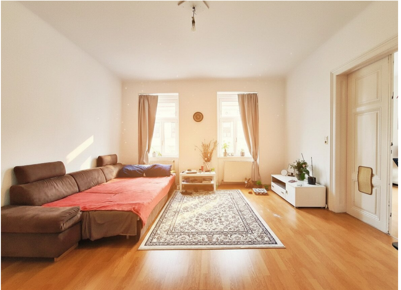
Wohnzimmer (Wohnung 2)