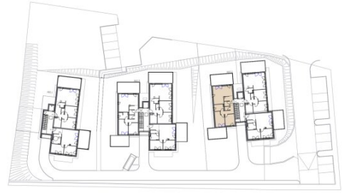
1. Obergeschoss Haus A.75 1:100