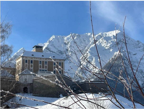
Nord-West Perspektive o.M.