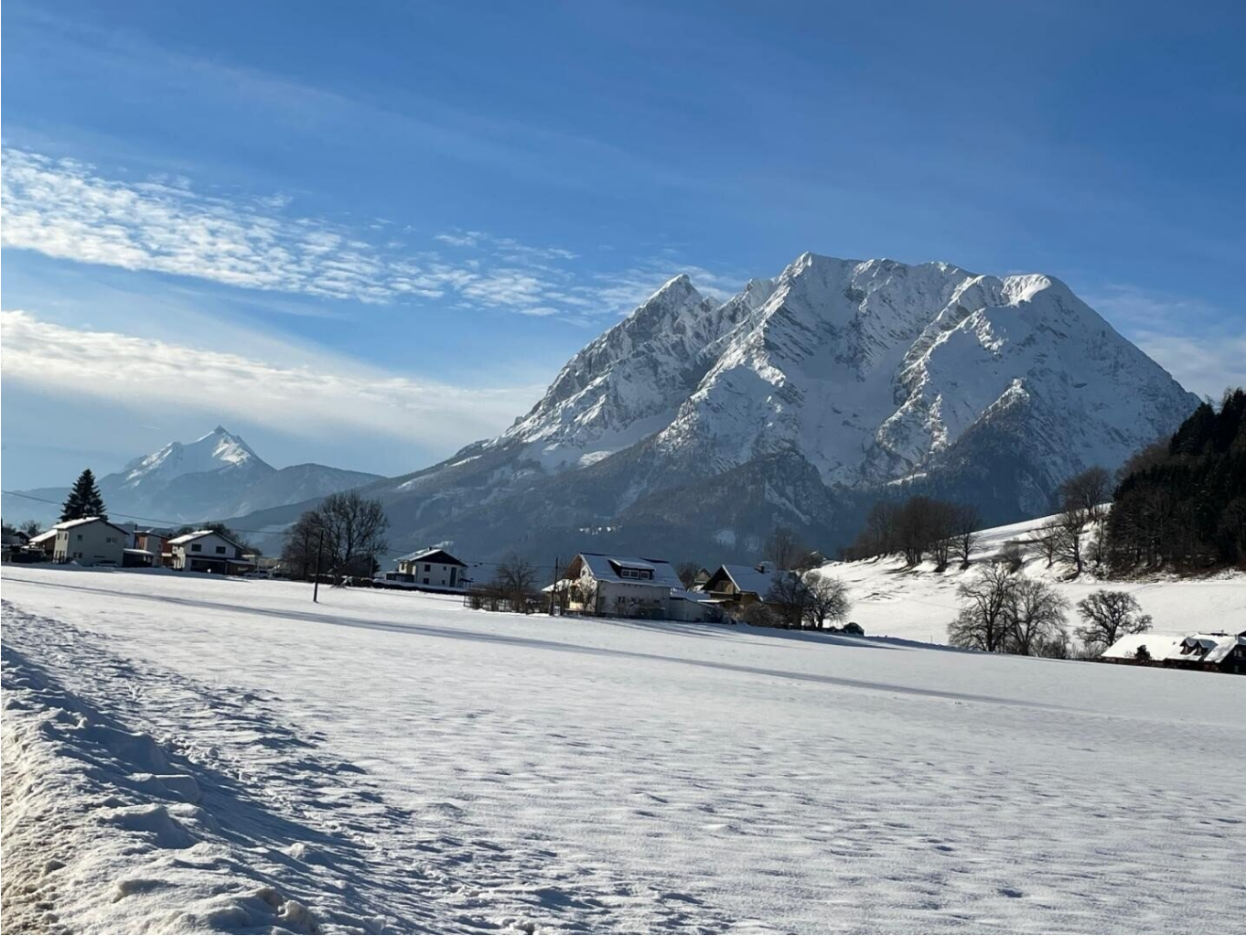
Nord-West Perspektive o.M.