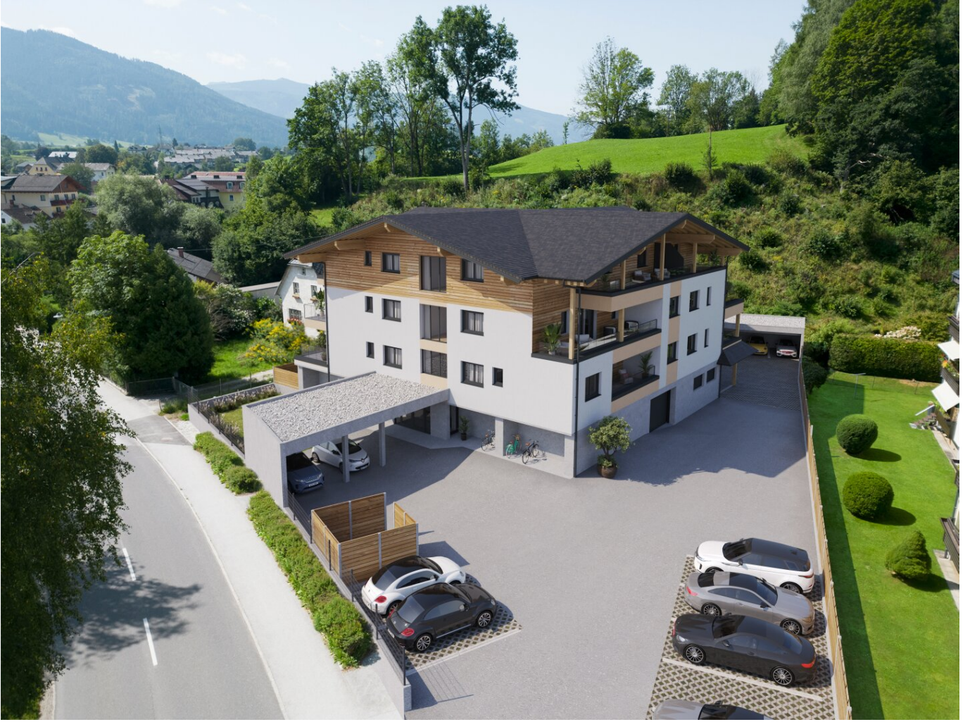
Süd-West Perspektive o.M.