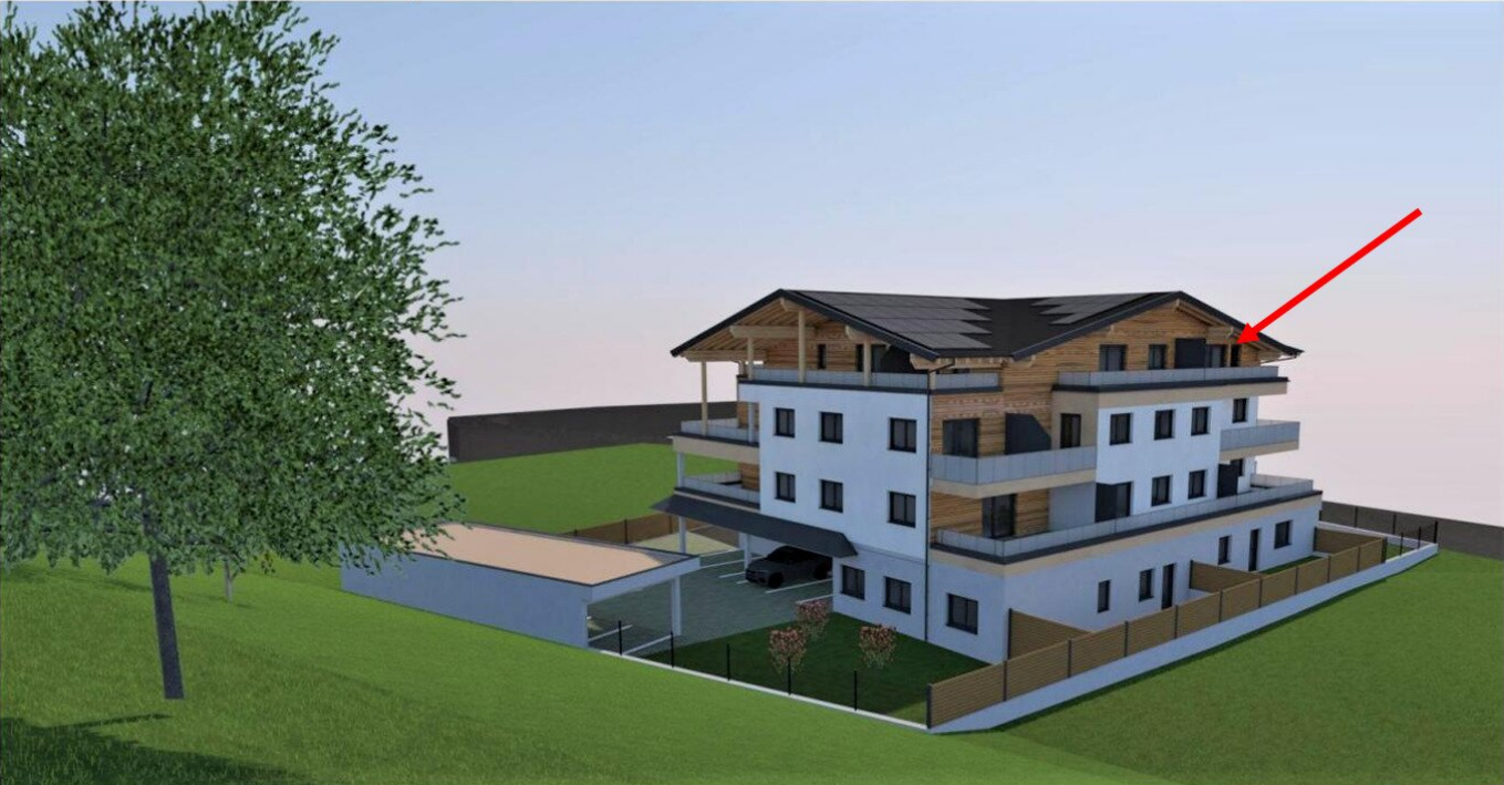
Ansicht Süd 1:100