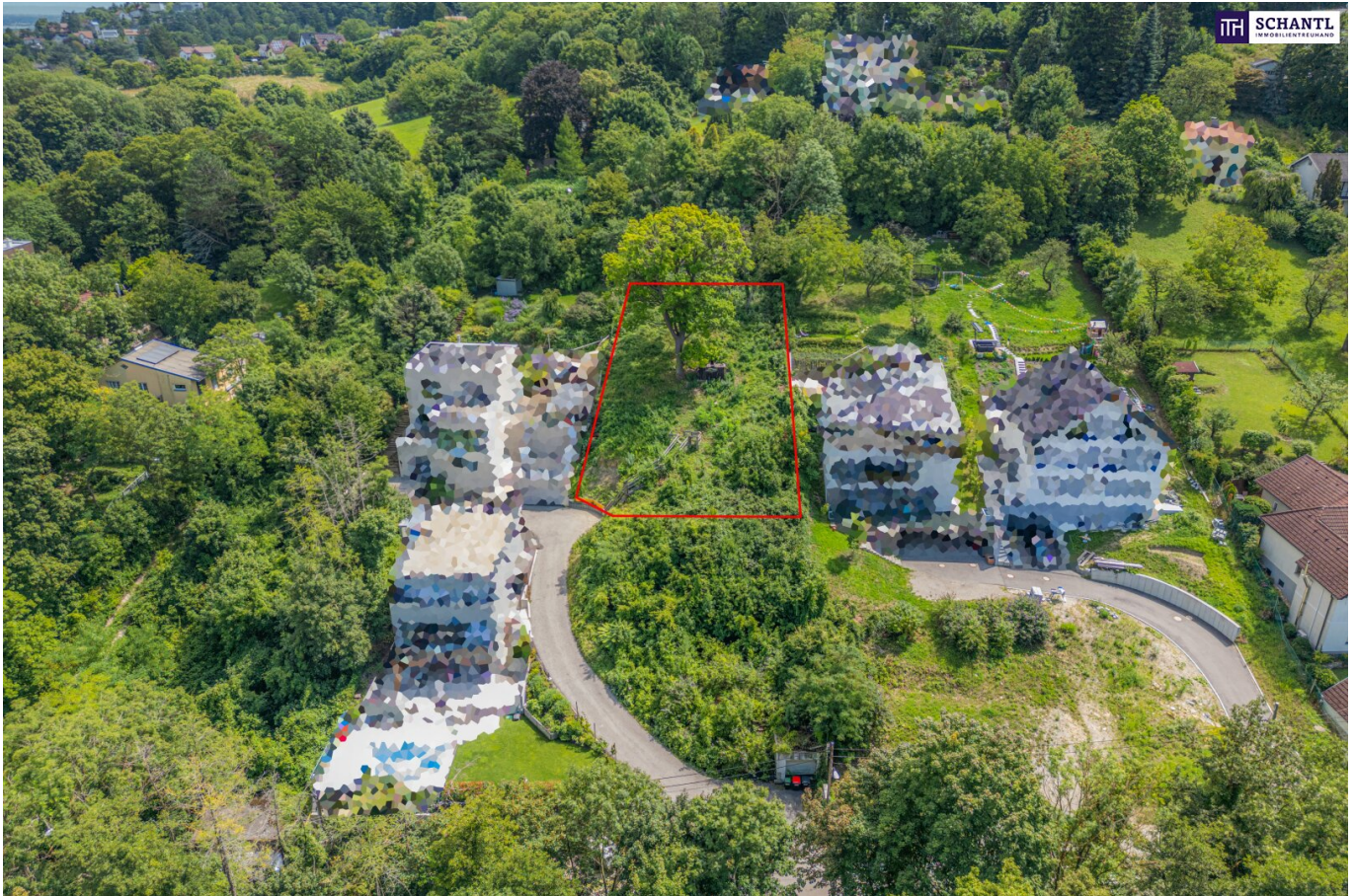
Abbildung von Grundstück und Umgebung aus der Vogelperspektive